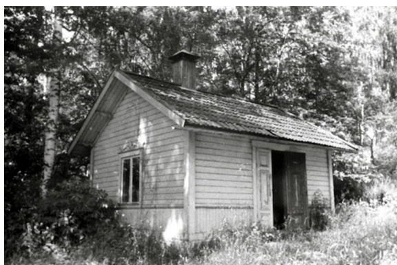
Tvättstugan vid Strandvik en del av dess kulturmiljö.