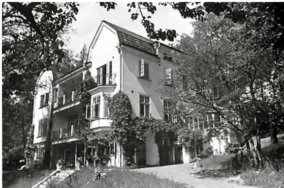
Det rivna orangeriet t.h. i bilden borde återskapas.