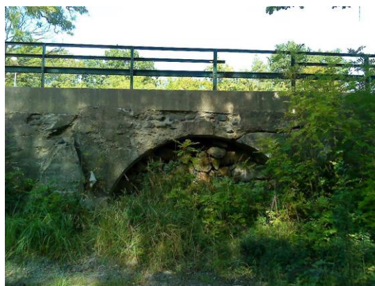
Det äldre brovalvet borde skyddas och bevaras.